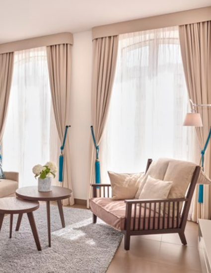
Hapimag Resort Lisbon