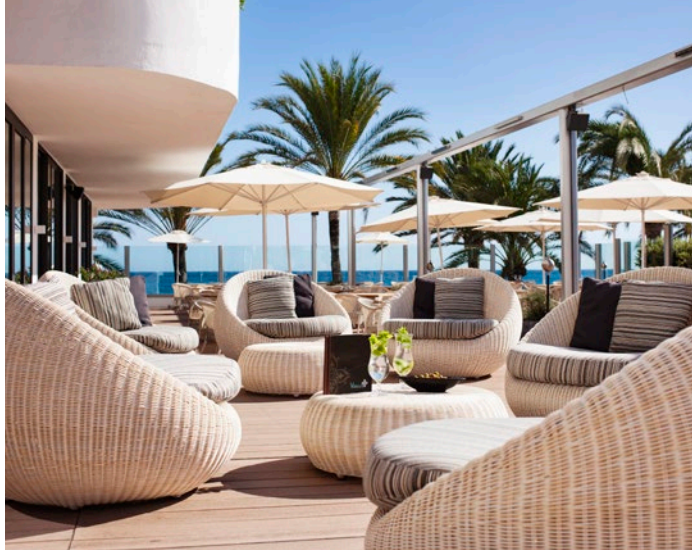
Hapimag Resort Marbella